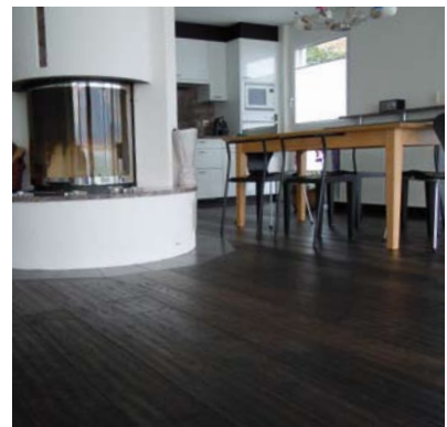
Der Wohn- und Essbereich